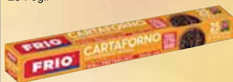
Carta Forno Fogli Extra Grandi Pretagliati FRIO cm 36x42 25 Fogli