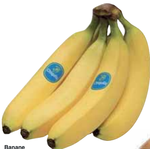
Banane CHIQUITA provenienza estero al kg