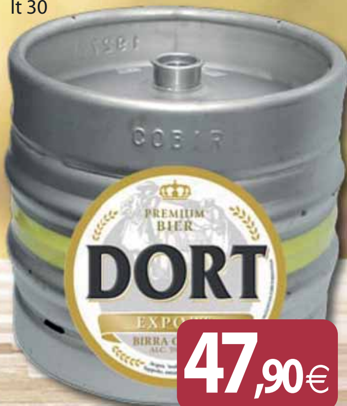
Birra Pils Lager DORT lt 30