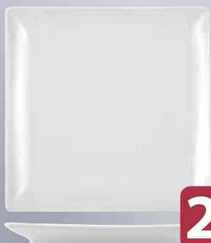
Piatto Frutta Bianco Porcellana BOSTON cm 18 x 18