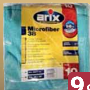
Panni Multiuso Microfiber ARIX cm 38x38 pz 10