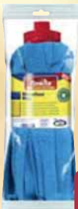
Mop Microfloor Microfibra TONKITA pz 1