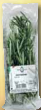
Rosmarino AROMADOMUS g 30