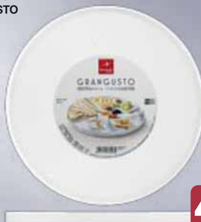
Piatto Vetro Opale GRANGUSTO cm 27