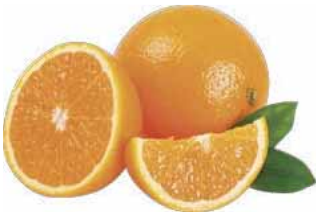
Arance Navel Foglia provenienza nazionale al kg