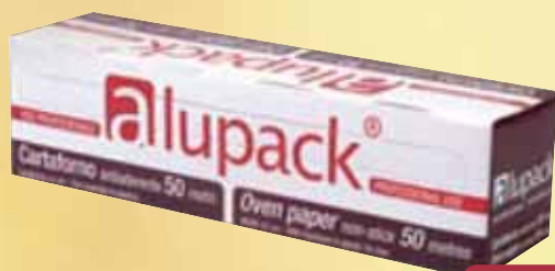
Carta Forno ALUPACK mt 50