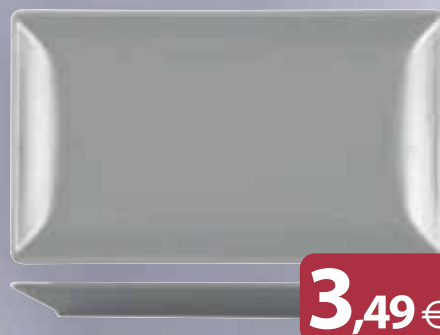
Piatto Rettangolare Grigio Porcellana BOSTON cm 25 x 15