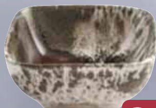
Coppetta Verde CRACKLE