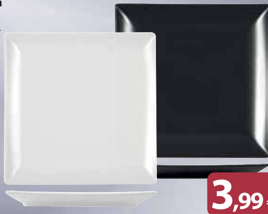
Piatto Piano Bianco, Nero Porcellana BOSTON cm 24 x 24