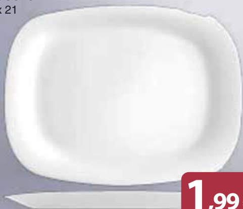
Piatto Piadina Vetro Opale GRANGUSTO cm 28 x 21