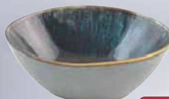
Coppetta Ottanio CRACKLE