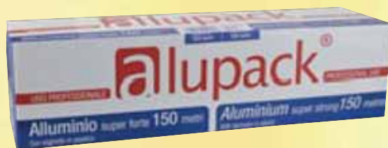
Alluminio Roll ALLUPACK mt 150