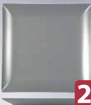
Piatto Frutta Grigio Porcellana BOSTON cm 18 x 18