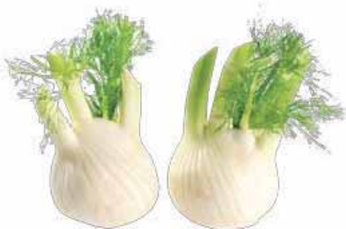
Finocchi provenienza nazionale al kg