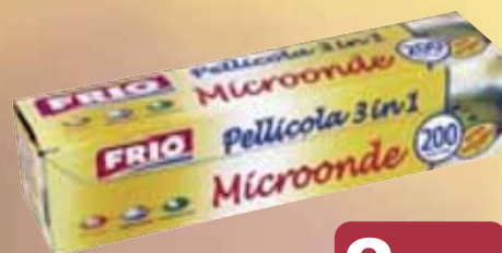
Pellicola Microonde FRIO mt 200