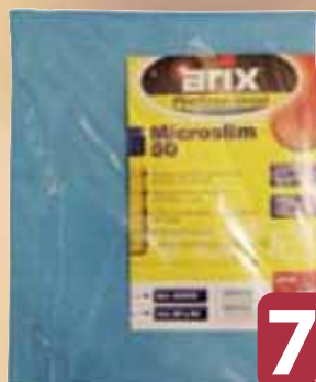
Panni Multiuso Microslim ARIX cm 40x50 pz 5