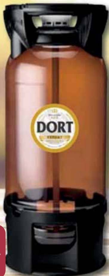
Birra Pet Pils Lager DORT lt 20