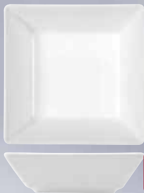
Piatto Fondo Bianco Porcellana BOSTON cm 17 x 17