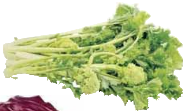
Cime di Rapa provenienza nazionale al kg