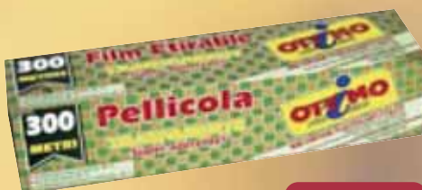
Pellicola Trasparente OTTIMO mt 300